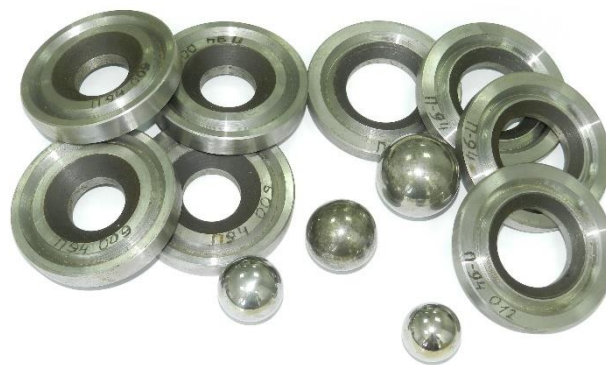
Диафрагмы и шары для бароциклического воздействия

Диафрагмы промаркированы и устанавливаются в соответствии с обозначением позиции седла