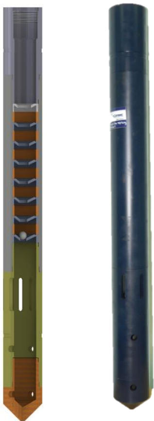
Пульсатор П-94 «Геркулес» для бароциклического воздействия

Оборудование для бароциклического воздействия П-94 «Геркулес» изготовлено по ТУ 3666.001.13784960.2013 и состоит из корпуса, переводника с муфтой ВНКТ-73 и ловушки с отверстиями. В корпус установлены диафрагмы, разделяемые втулками. диафрагмы установлены по мере уменьшения размера центрального промывочного отверстия к забою скважины.