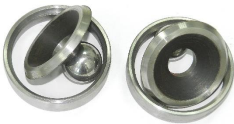
Разрушенные при срыве диафрагмы

В качестве интенсифицирующего состава используются растворы ПАВ, растворители, кислоты. Объем закачки интенсифицирующего состава составляет 0,5-1 м 3 на 1 метр перфорированной мощности пласта. Пульсатор в процессе работы перемещают в осевом направлении по мере обработки призабойной зоны пласта. Оборудование обеспечивает создание до 7 циклов ударного воздействия за одну СПО. Глубина воздействия при такой технологии более 2 метров.